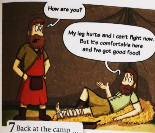
7 Back at the camp ...