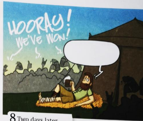
8 Two days later ...

86/5 2 What do you think, what does the soldier in picture 8 say? Write a sentence. (individuelle Lösung)